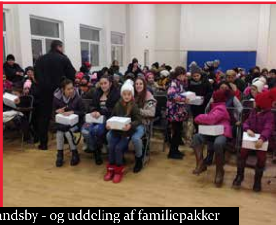
Lægebesøg i roma-landsby - og uddeling af familiepakker ind under jul 2018