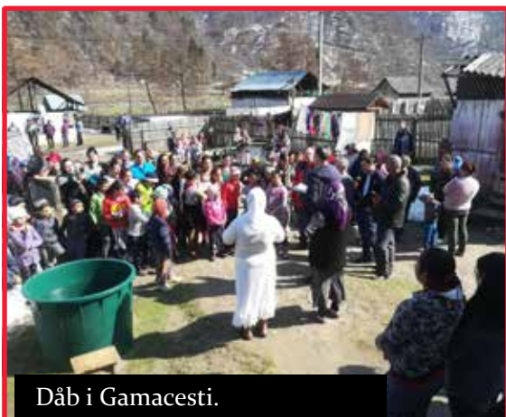
Dåb i Gamacesti.

I september blev huset så bygget ved hjælp af et dansk team – og nogle