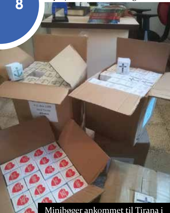
Minibøger ankommet til Tirana i Albanien.