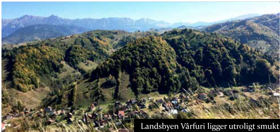
Landsbyen Vårfuri ligger utroligt smukt i et kuperet terræn

For at beholde retten til, at gaver kan trækkes fra i skat, skal DBM opretholde sit medlemstal på over 300 medlemmer. Det koster kun 50,- kr. årligt at være medlem. Tak for hvert enkelt medlemsbidrag. Få også gerne flere til at modtage bladet. Det sendes gratis!