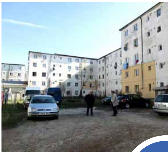
Roma-blokke i Câmpulung

Mange har siden Ceaușescus fald som diktator trukket sig ud af de